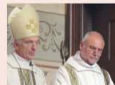
Ook de aartsbisschop komt regelmatig naar Culemborg.

Als Culemborgse geloofsgemeenschap dragen wij bovenstaande bedrag bij aan de pot van de landelijke kerk van waaruit de pastoorssalarissen betaald worden. Onze pastoor heeft een aanstelling van 12 uur in de week maar doet daarnaast in eigen tijd nog heel veel voor de parochie. Daarnaast worden van deze gelden de reiskosten vergoed die nodig zijn voor de pastorale zorg in onze regio.