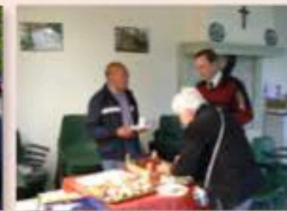
'Het Zaaltje': koffie- en ontmoetingsruimte.