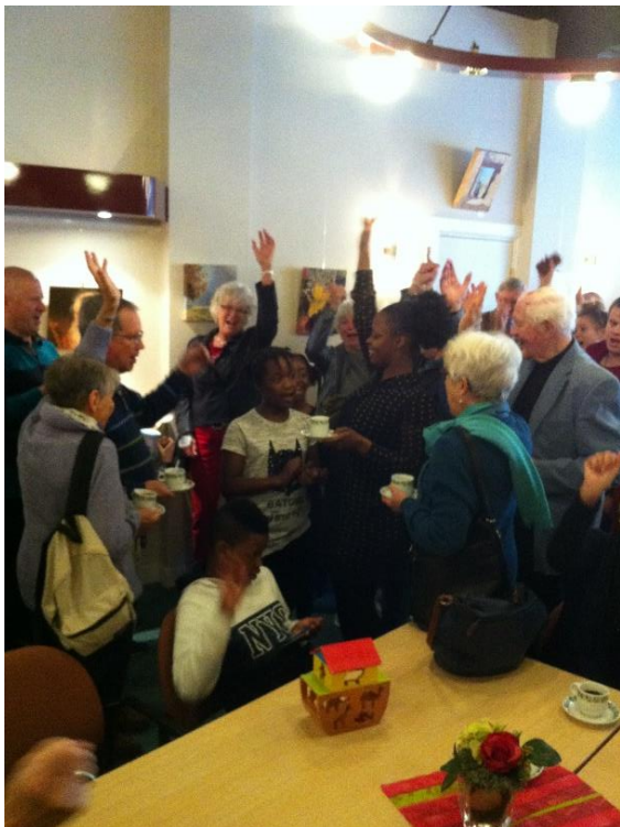
Verjaardagen worden gevierd

U ziet, diverse activiteiten die verbinding leggen tussen jong en oud, binnen en buiten de parochie. Sommige activiteiten kosten weinig geld, andere activiteiten zijn kostbaarder. Om dit alles in stand te houden is uw bijdrage nodig.