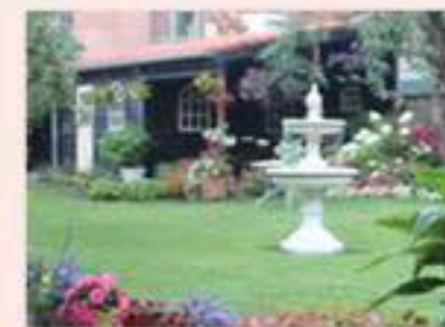
Gerenvoerde binnentuin (met geschonken schuurtje!)

Het gebruiken van een kerkgebouw (en van de bijgebouwen zoals de pastorie, het zaaltje achterin de tuin, e.a.) kost geld. Stoken (vooral 's winters) is kostbaar. Denkt u eens aan gas, water, elektriciteit, verzekeringen, telefoon en internet, kaarsen en bloemen. Het bovenstaande bedrag betreft de kosten van het gebruik en geeft dus enkel aan wat er nodig is aan inkomsten om de lopende parochie-uitgaven te dekken.