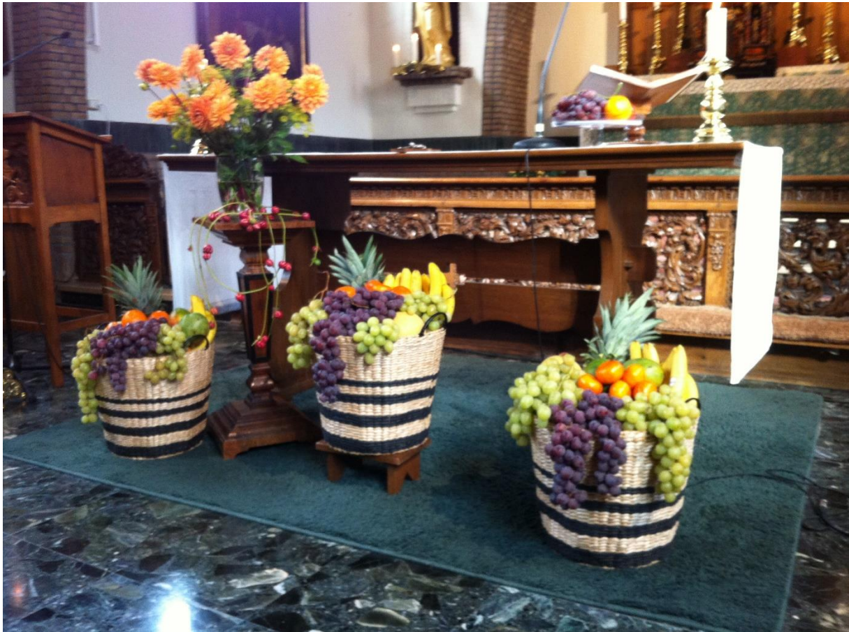
De jaarlijkse oogstdienst. De fruitmanden gingen naar de Daklozenopvang en de Voedselbank in Amersfoort