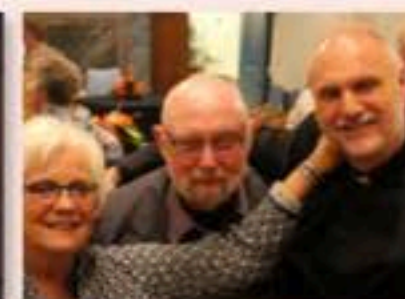
In contact met elkaar.