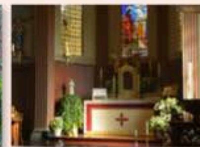
Absis van de Oud-Katholieke Kerk.

PASTOOR, PASTORALE ZORG, VIERINGEN: € 14.175,-