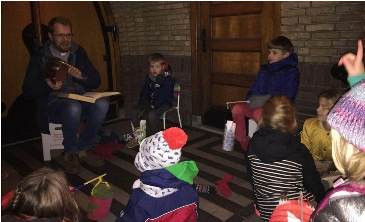
11 november 2016 Het verhaal van Sint Maarten in het kerkportaal voor de kinderen uit de buurt