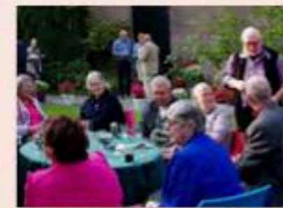
De tuin: een belangrijke plaats van ontmoeting.

Om toekomst te garanderen voor onze parochie is groei nodig. Belangrijk element daarbij is onze presentatie. Gelukkig zijn de kerk en het orgel voor het grootste deel in goede staat van onderhoud, maar de pastorie, het zaaltje, het sanitair, en andere zaken vragen naast onderhoud ook om vernieuwing. Voor het resterende onderhoud van de kerk is subsidie aangevraagd: deze wordt verleend op voorwaarde dat we zelf de helft betalen.