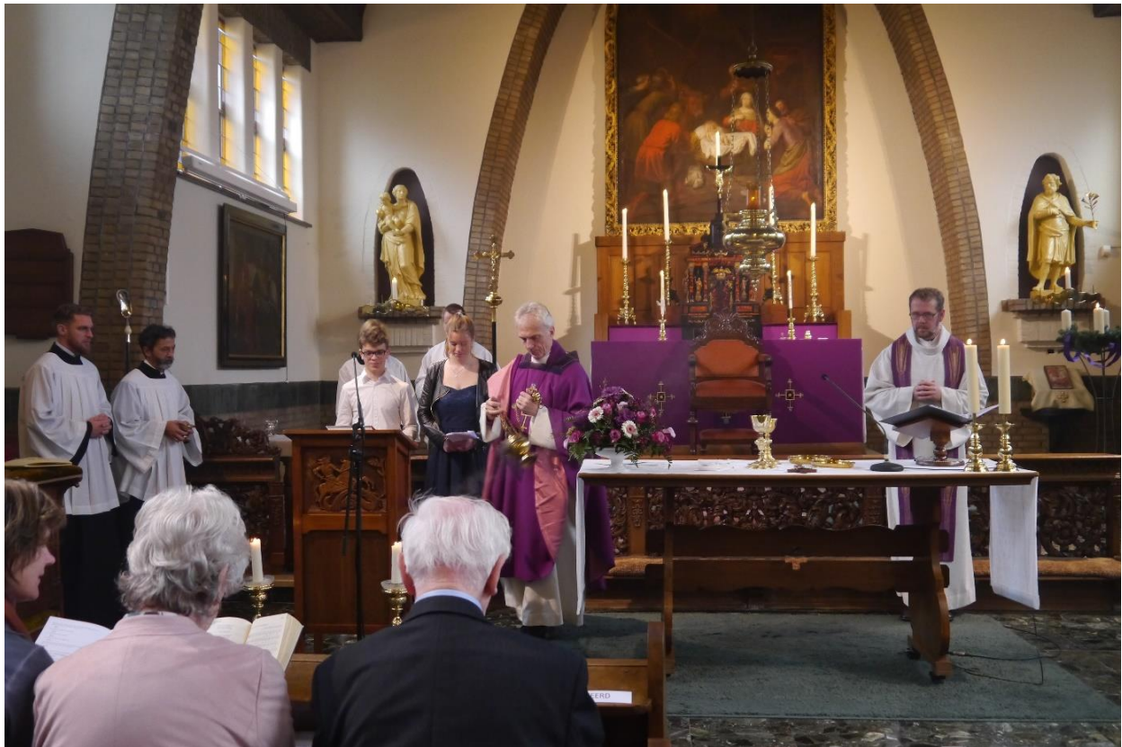
Heilig vormsel op 27 november 2016

Kerkbalans is een gezamenlijke actie van de Rooms-Katholieke Kerk, de Protestantse Kerk en de Oud-Katholieke Kerk van Nederland. Drie kerkgenootschappen die al sinds 1973 een beroep doen op de plaatselijke geloofsgemeenschappen voor een financiële bijdrage. Jaarlijks vragen zij hun leden in de tweede helft van januari gul te geven voor hun eigen plaatselijke kerk.