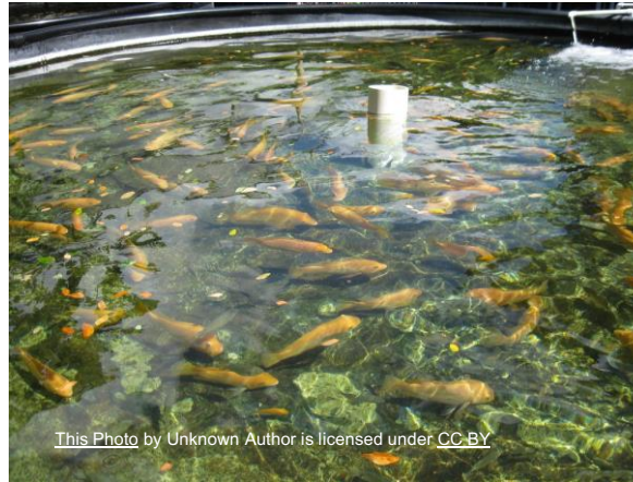
Derde partij vrijwilligers hulpbron