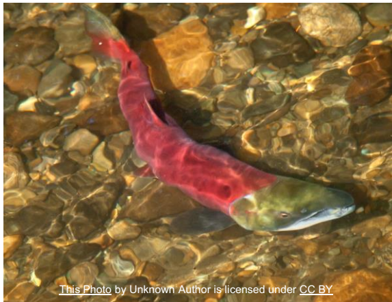
Traditionele vrijwilligers hulpbron